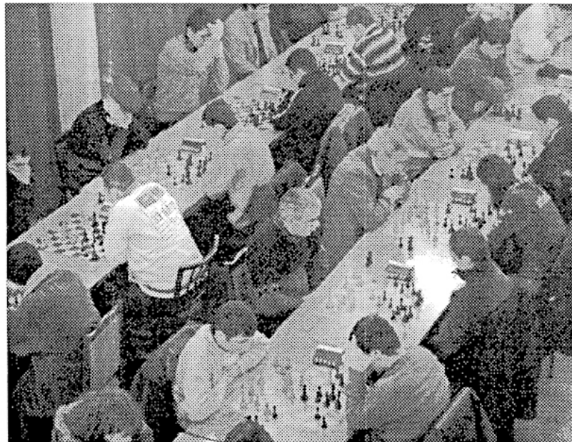
Հայաստանի 67-րդ առաջնության բարձրագույն խմբի մրցաշարի ավարտից հետո շախմատի տանն անցյալցվում է եւս մեկ հանրապետական առաջնություն՝ արագ շախմատի վարկածով: Մանրամասները՝ ՇԳ-ի հաջորդ համարում:

1.e4 c5 2.ճf3 g6 3.d4 ձg7 4.ճc3 ed4 5.ճd4 ճc6 6.e3 ճf6 7.ձe2 0-0 8.0-0 d6 9.b3 ձd7 10.ձb2 a6 11.Պd2 1/2-1/2