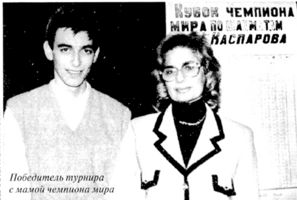
Победитель турнира с мамой чемпиона мира